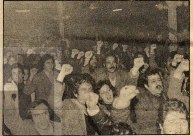
Bütün saloh 1 Mayıs marşını ayakta, sağ yunrukları sıkılı olarak dev bir koro halinde, büyük bir coşkuyla söylüyordu.

Öğretmen Dayanışma Gecesine, iclerinde T. Maden - İş, Bank - Sen, Teknik - İş, TÜS - DER, İGD, İKD, GIB - DER genel merkezleriyle İstanbul DDKD, KÖGEF, TÜTED gibi 60'ı aşkın demokratik kitle örgütü ve işçi sendikasıyla dayanışma mesajları gelmiştir. Bu mesajlar gecenin ilerici güçlerin birliği açısından da taşıdığı önemi yansıtmaktadır.