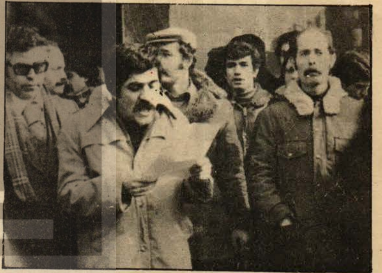
Genel Merkez önündeki basın toplantısı.